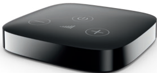
Zařízení TV Connector